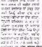
ਅਧਿਆਪਕਾਂ ਦੇ ਅਭਵਲੇ ਹੀ ਦਿਨ ਗੀ ਸੀ ਨੇ ਕੀਤਾ।

ਸੰਗਰੂਰ, 12 ਅਪ੍ਰੈਲ ਅਧਿਆਪਕਾਂ ਦੇ ਅਭਵਲੇ ਹੀ ਦਿਨ ਗੀ ਸੀ ਨੇ ਕੀਤਾ।