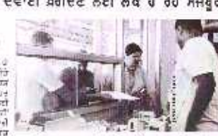
ਹਸਪਤਾਲ ਵਿੱਚੋਂ ਪੂਰੀ ਦਵਾਈ ਨਾ ਮਿਲਣ 'ਤੇ ਨਿਜੀ ਦਵਾਖਾਨਿਆਂ ਤੋਂ ਦਵਾਈ ਖਰੀਦਣ ਲਈ ਲੋਕ ਹੋ ਰਹੇ ਮਸਬੂਰ