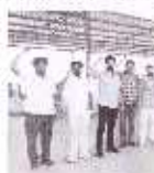
ਸਿਕੰਦਰਾਂ ਦੇ ਅਧਿਆਪਕਾਂ ਨੇ ਤਨਖਾਹਾਂ ਨਾ ਮਿਲਣ ਕਾਰਨ ਅਧਿਆਪਕਾਂ ਨੇ ਸਿਕੰਦਰਾਂ ਵਿਖੇ ਨਾਅਰੇਬਾਜ਼ੀ ਕੀਤੀ।

ਸੰਗਰੂਰ, 12 ਅਪ੍ਰੈਲ ਸਿਕੰਦਰਾਂ ਦੇ ਅਧਿਆਪਕਾਂ ਨੂੰ ਤਨਖਾਹਾਂ ਨਾ ਮਿਲਣ ਕਾਰਨ ਅਧਿਆਪਕਾਂ ਨੇ ਸਿਕੰਦਰਾਂ ਵਿਖੇ ਨਾਅਰੇਬਾਜ਼ੀ ਕੀਤੀ।