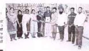
ਸਿੱਖਮ ਕਾਲਜ ਦੇ ਵਿਦਿਆਰਥੀ ਨੇ ਮਾਰੀਆਂ ਮੱਲਾਂ